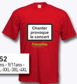
TS2 Tailles : 7/8ans - 9/11ans - XS-S-M-L-XL-XXL-3XL-4XL