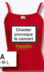
DB2A Tailles : S-M-L