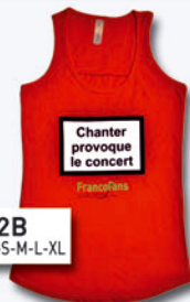
DB2B Tailles : XS-S-M-L-XL